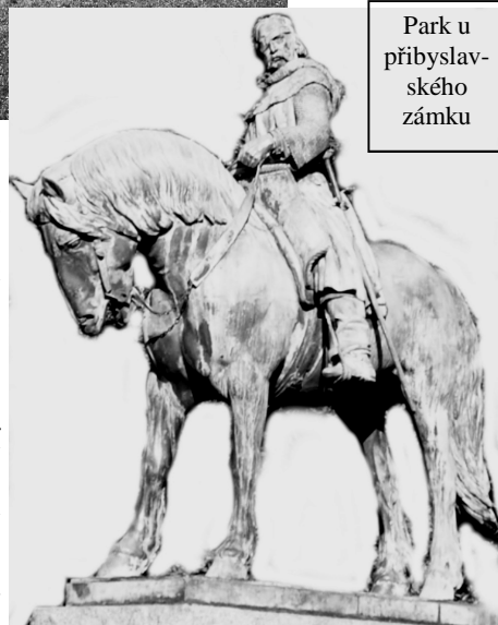
Park u příbyslavského zámku