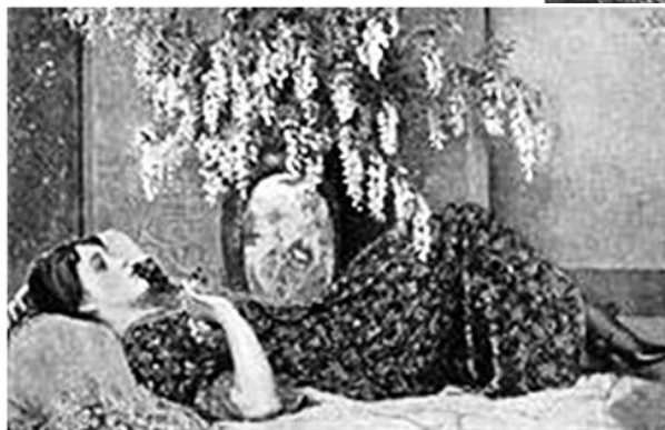
Otto Peters, Zlatý déšť, 1916